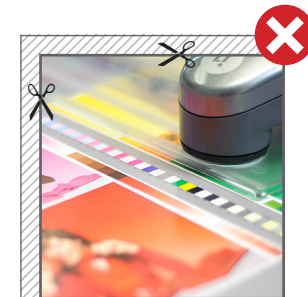
■ Fig. 1: Hintergründe bitte immer vollflächig anlegen. // Fig. 1: Please use backgrounds full surface.