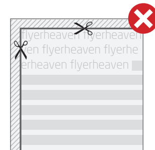
■ Fig. 2: Texte bitte immer mit einem Sicherheitsabstand zur Schneidekante anlegen. // Fig. 2: Please insert text always with a safety margin from the cutting edges.